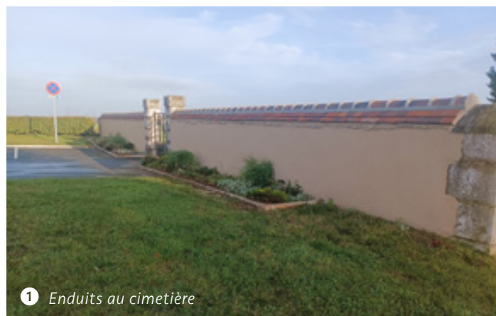
1 Enduits au cimetière

Ces travaux ont pu être réalisés grâce au soutien du conseil départemental (Dotation de Solidarité Rurale).