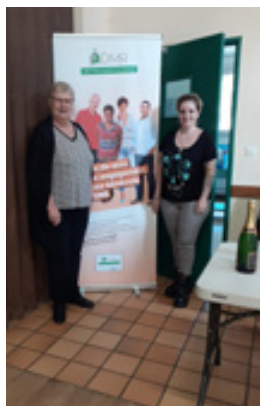
AG du 21 septembre Nouveau bureau