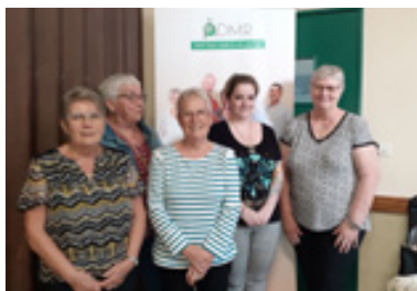
Nouvelles bénévoles recrutées