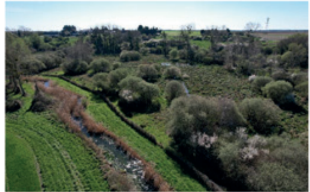
Zone humide des Tresseaux (Averdon) restaurée dans le CT 1

L'année 2022 a vu la fin du deuxième Contrat Territorial « Cisse ». A la suite de cette expérience, le syndicat a souhaité s'engager dans un troisième contrat pour poursuivre les efforts réalisés depuis plus de 10 ans. L'année 2023 a donc été consacrée à la préparation de ce troisième contrat, qui devrait voir le jour à partir de 2024 pour une durée de 2 fois 3 ans. Les principales orientations de ce futur contrat vous sont présentées ci-dessous :