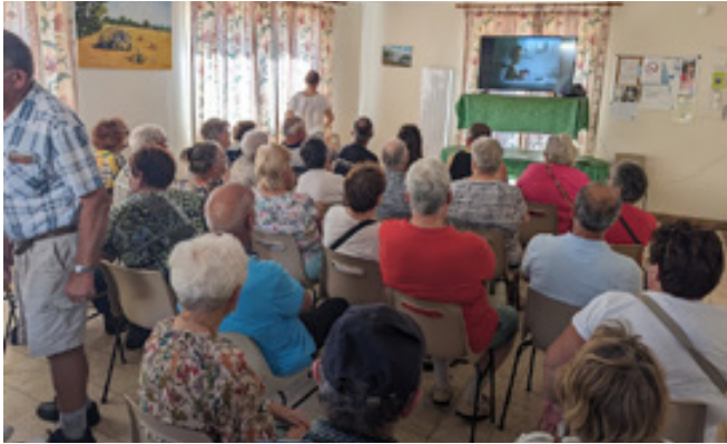
Noël des enfants de Baigneaux et Ste Gemmes, avec l'école blésoise du cirque